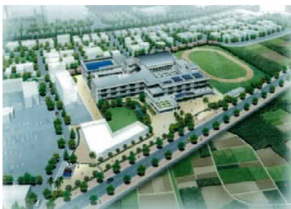
はごろも小学校校舎・水泳プール・地域・ 学校連携施設基本・実施設計業務 イメージパース

基本計画（企画・調査）、基本設計、実施設計 許認可申請手続き、工事見積り・契約、工事監理