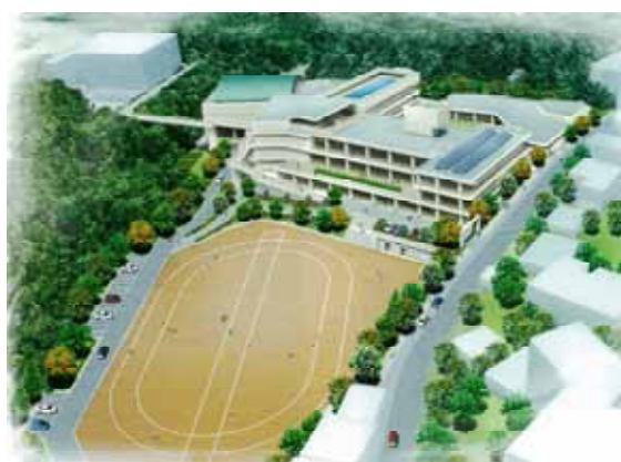
志真志小学校・志真志幼稚園建替基本計画 イメージパース