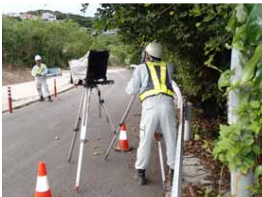
電子平板測量状況