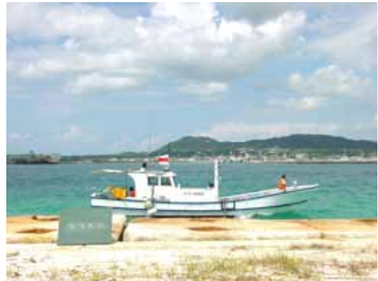
D-GPS 誘導による深淺測量状況