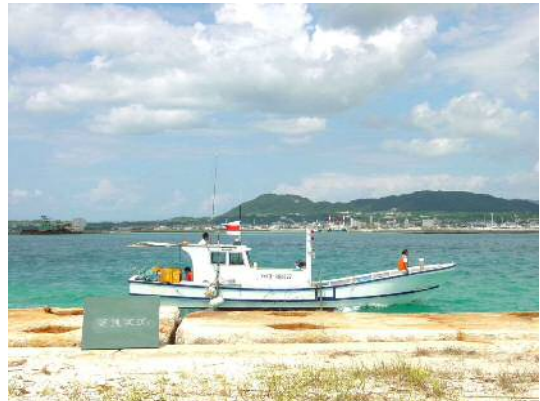
D-GPS 誘導による深淺測量状況