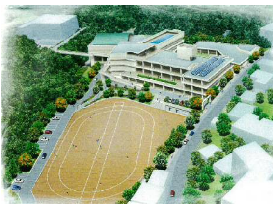
志真志小学校・志真志幼稚園建替基本計画