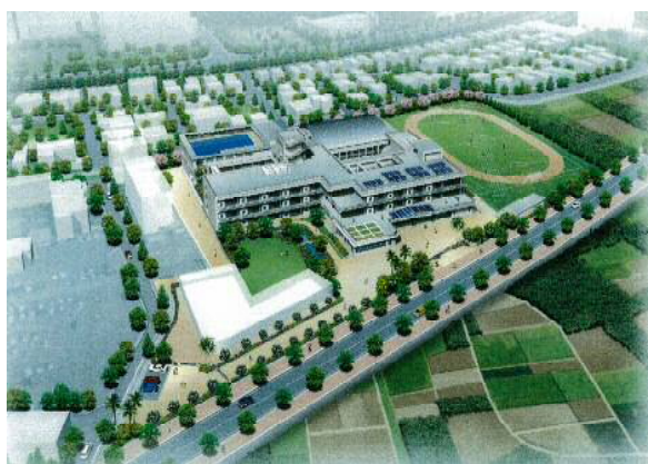
はごろも小学校校舎・水泳プール・地域・

基本計画（企画・調査）、基本設計、実施設計 許認可申請手続き、工事見積り・契約、工事監理