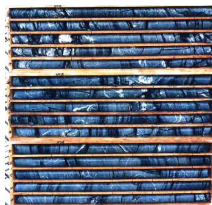
ボーリング採取試料