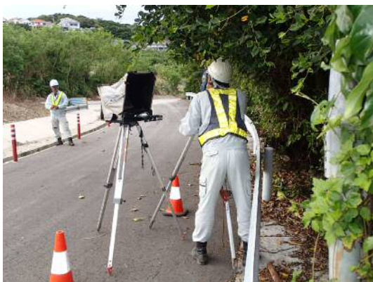
電子平板測量状況