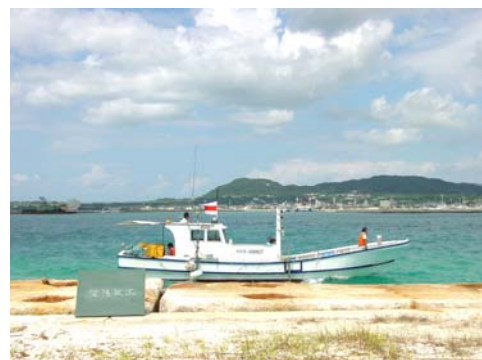
GPS 誘導による深淺測量状況