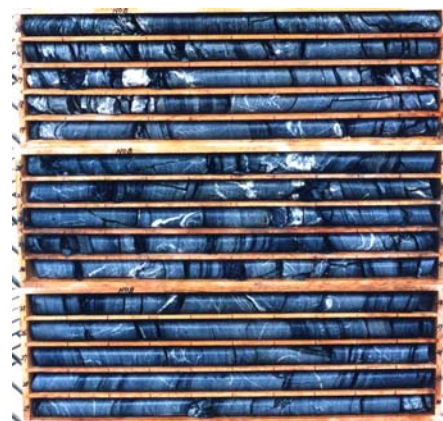
ボーリング採取試料