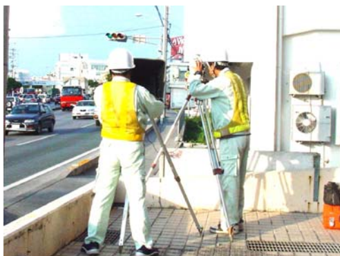
電子平板測量状況