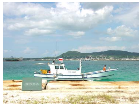
GPS 誘導による深淺測量状況