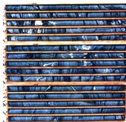
ボーリング採取試料