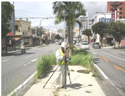
ネットワーク型 RTK-GPS 観測状況